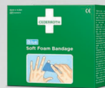
Cederroth Soft laastari 4,5 m REF 51011010

Liimaton, itsekiinnittyvä laastari. Soveltuu pieniin haavoihin ja toimii erilaisissa olosuhteissa riippumatta lämmöstä, kylmästä, kosteudesta tai kuivuudesta ja pysyy jopa vedessä. Laastarin leveys 6 cm.