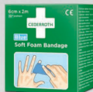
Cederroth Soft laastari 2 m REF 51011011

40 kpl steriilejä, yksittäispakattuja, fysiologista keittosuolaa sisältäviä haavapyyhkeitä. Sopii Haavanhoitoautomaattiin (REF 51011006 ja 51011009)