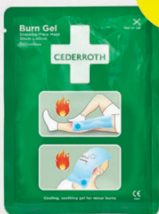
Cederroth Burn Gel Palovammataitos/ Kasvomaski 30x40 cm REF 51011014

Soveltu laaja-alaisempien palovammojen ensiapuun, kuten jalat, kädet, rinta/selkä. Taitokseen on perforoitu silmä-, nenä- ja suuaukot, jolloin taitosta voidaan käyttää myös kasvojen palovammoissa. Jäähdyttää ja lievittää kipua ensimmäisen ja toisen asteen palovammoissa.