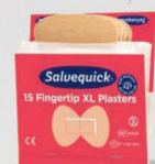
Salvequick sormenpäälaastari REF 6454

21 kpl leveää, joustavaa ja hengittävää kangaslaastaria isomman haavan hoitoon. Allergiatestatu. 6 täydennyspakkausta/rasia.