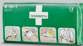
Cederroth 4-in-1 iso ensiapuside REF 1910

150 ml steriiliä keittosuolaliuosta pölyn ja lian huuhteluun haavoista ja silmistä. Voidaan käyttää useita kertoja ja säilyy steriilinä viimeiseen pisaraan saakka. Säilyvyys 5 vuotta.