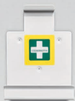
Seinäteline REF 51000008

Kovamuovista valmistettu lujatekoinen ja kestävä pakki suojaa tuotteet iskulta, pölyltä ja kosteudelta. Pakin ulkokannessa on laastariautomaatti. Tuotteet kuten käsineet, sakset ja elvytysuoja on sijoitettu pakin sisäkanteen. Lokerikon punaiset tarrat ilmaisevat, kun tuote on lopussa ja täydennystä tarvitaan. Huomiovärien ansiosta pakin havaitsee jo kaukaa. Tilaa silmänhuuhtelupullolle tai omille tuotevalinnoille.