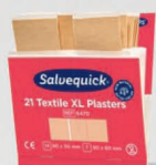
Salvequick iso kangaslaastari REF 6470

40 kpl kankaista, joustavaa, hengittävää ja hyvin kiinnittyvää peruslaastaria. Allergiatestatu. 6 täydennyspakkausta/rasia.