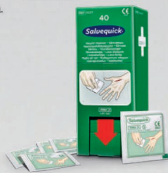
Salvequick haavapyyhe 40 kpl REF 3227

20 kpl steriilejä, yksittäispakattuja, fysiologista keittosuolaa sisältäviä haavapyyhkeitä. Sopii ensiapuasemaan (REF 490920) ja ensiapuasema Pron (REF 51011003).