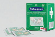
Salvequick haavapyyhe 20 kpl REF 323700

Suojaa suoralta kosketuksesta elvytystilanteissa. Sisältää elvytysuojan yksisuuntaisella venttiilillä, 2 paria suojakäsineitä ja 2 kpl Cederroth käsin puhdistuspyyhkeitä.