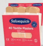
Salvequick kangaslaastari REF 6444

45 kpl vettä ja likaa hylkivää muovilaastaria. Hyvin kiinnittyvä, joustava ja allergiatestatu. 6 täydennyspakkausta/rasia.