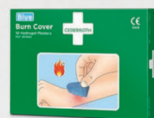
Cederroth Burn Cover REF 901903

Palovammageeli pieniin ensimmäisen ja toisen asteen palovammoihin ja auringonpoltamiin. Jäähdyttää ja rauhoittaa ihoa sekä lievittää tehokkaasti kipua. Monikäyttöinen, voidaan käyttää useampaan kertaan.