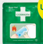
Cederroth Burn Gel Palovammataitos 20x20 cm REF 51011015

Soveltu laaja-alaisempien palovammojen ensiapuun, kuten jalat, kädet, rinta/selkä. Taitokseen on perforoitu silmä-, nenä- ja suuaukot, jolloin taitosta voidaan käyttää myös kasvojen palovammoissa. Jäähdyttää ja lievittää kipua ensimmäisen ja toisen asteen palovammoissa.