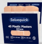
Salvequick muovilaastari REF 6036

Liimaton, itsekiinnittyvä laastari. Soveltuu pieniin haavoihin ja toimii erilaisissa olosuhteissa riippumatta lämmöstä, kylmästä, kosteudesta tai kuivuudesta ja pysyy jopa vedessä. Laastarin leveys 6 cm.