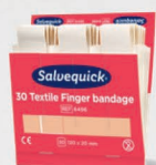
Salvequick erikoispitkä kangaslaastari REF 6496

15 kpl joustavaa ja hyvin kiinnittyvää sormenpäälaastaria. Muotoilun ansiosta heppo kiinnittää. 6 täydennyspakkausta/rasia.