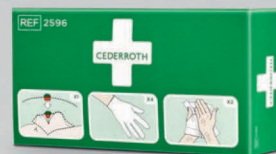
Cederroth tartuntasuojapakkaus REF 2596

Steriili yleisside neljään eri käyttötarkoitukseen, erityisesti sormien ja varpaiden haavojen sidontaan.