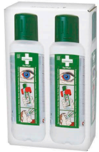
725200 Silmän- huuhdepullo 2 x 500 ml