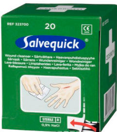
323700 Haavapyyhetäydennys 20 kpl