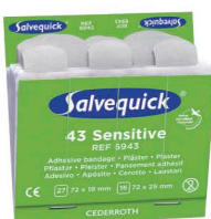
6943 Kuitukangas- laastari yliherkille 6 x 43 kpl/rasia