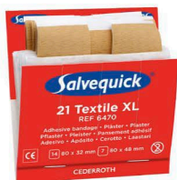
6470 Iso kangaslaastari 6 x 21 kpl/rasia