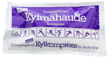
11125 Pikakylmähaude kertakäyttöinen