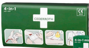
1910 Iso ensiapuside