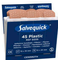
6036 Muovilaastari- täydennys 6 x 45 kpl/rasia