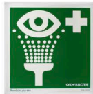
17201 Opastekilpi 20 x 20 cm Silmänhuuhtelu, jälkivalaiseva