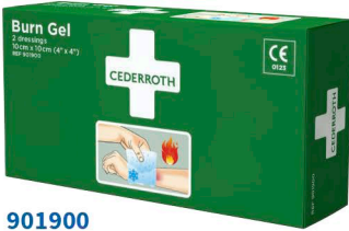
901900 Burn Gel -palovammataitos 10 x 10 cm, 2 kpl