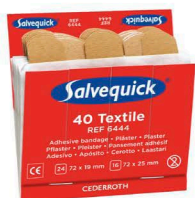
6444 Kangaslaastari- täydennys 6 x 40 kpl/rasia

Ensiaputarvikkeiden säännöllinen huolto ja materiaalin täydennys ylläpitää välineiden toimintavalmiutta. Täydennystilaukset voi tehdä kätevästi verkossa osoitteessa www.tammed.fi .