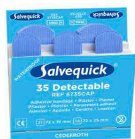
51030127 Muovilaastari elintarvike- teollisuuteen 6 x 35 kpl/rasia