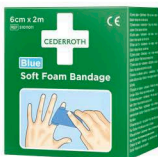
51011011 Soft-laastari Sininen 6 cm x 2 m