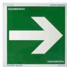
17151 Opastekilpi 20 x 20 cm Nuoli, jälkivalaiseva