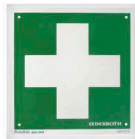
17181 Opastekilpi 20 x 20 cm Risti, jälkivalaiseva