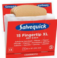
6454 Sormenpää- laastari 6 x 15 kpl/rasia