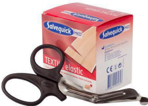
546264 Leikattava kangaslaastari 6 cm x 5 m