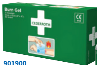
90190 Burn Gel -palovammatous 10 x 10 cm, 2 kpl