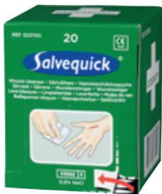
323700 Haavapyyhetäydennys 20 kpl