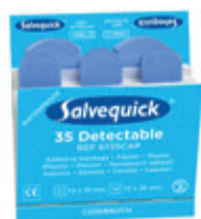
6735 Muovilaastari elintarvikke- teollisuuteen 6 x 35 kpl/rasia