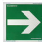
17151 Opastekilpi 20 x 20 cm Nuoli, jalkivalaiseva