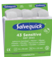
6943 Kuitukangas- laastari yliherkille 6 x 43 kpl/rasia