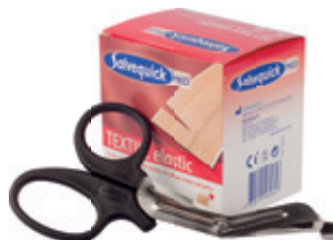
546264 Leikattava kangaslaastari 6 cm x 5 m