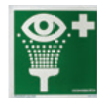
17201 Opastekilpi 20 x 20 cm Silmänhuuhde, jalkivalaiseva