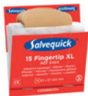
6454 Sormenpää- laastari 6 x 15 kpl/rasia