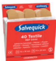
6444 Kangaslaastari- täydennys 6 x 40 kpl/rasia

Ensiaputarvikkeiden säännöllinen huolto ja materiaalin täydennys ylläpitää välineiden toiminta- valmiutta. Täydennystilaukset voi tehdä kätevästi verkossa osoitteessa www.tammed.fi .