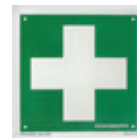
17181 Opastekilpi 20 x 20 cm Risti, jalkivalaiseva