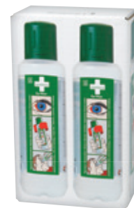
725200 Silmän- huuhdepullo 2 x 500 ml