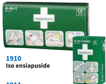
1910 Iso ensiapuside