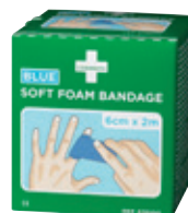
676100 Soft-laastari Sininen 6 cm x 2 m, 2 rs/me