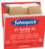
6470 Iso kangaslaastari 6 x 21 kpl/rasia