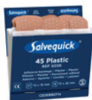
6036 Muovilaastari- täydennys 6 x 45 kpl/rasia