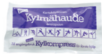
11125 Pikakylmähaude kertakäyttöinen